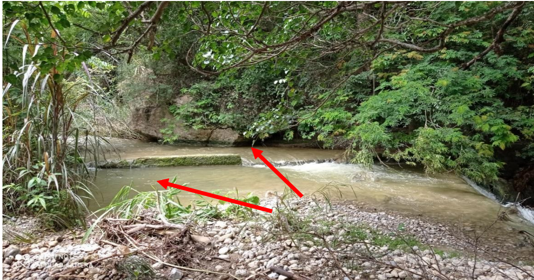
FOTOGRAFIA N°02: AFECTACION A BOCATOMA DEL CANAL LA VIÑA DEBIDO AL INCREMENTO DEL RIO.