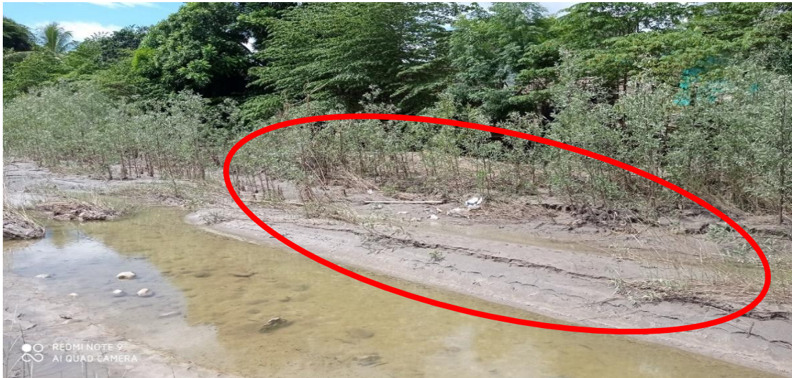
FOTOGRAFIA N°01: TRAMO CRÍTICO EN LA QUEBRADA HUAYAQUIL (QUEBRADA HUAYAQUILES)